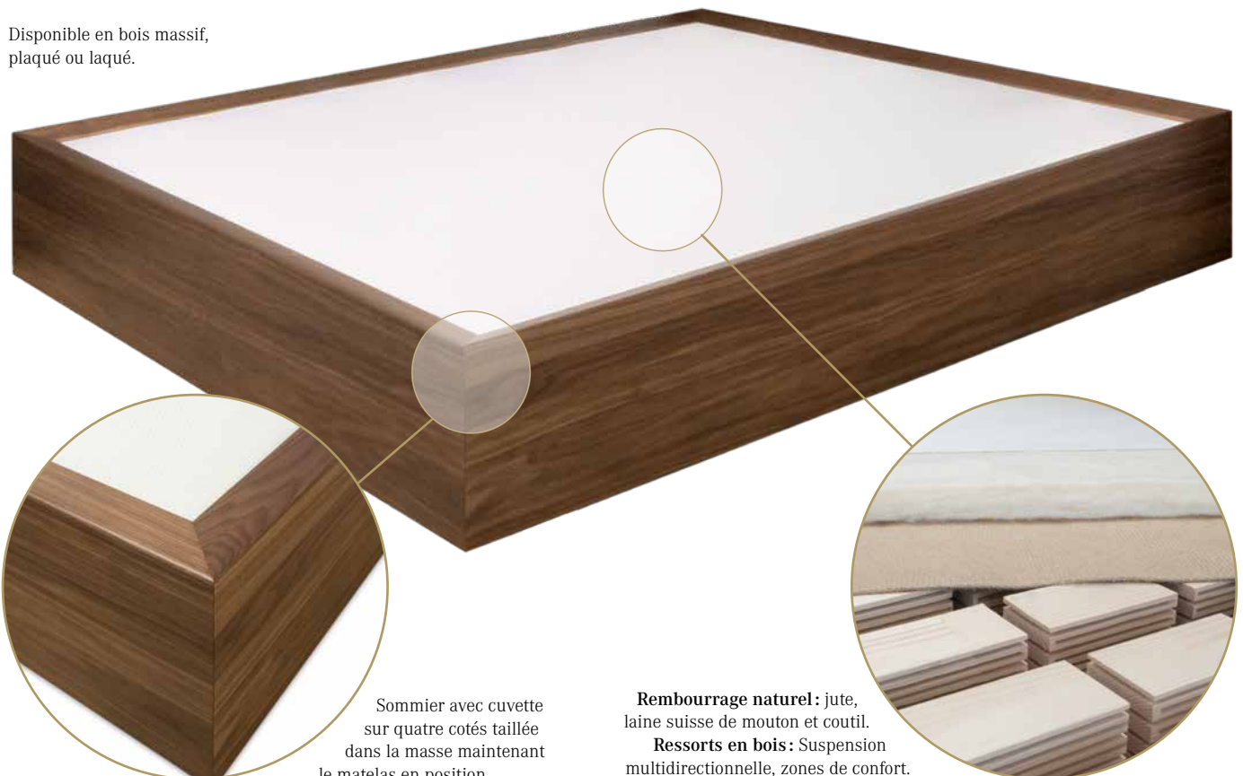
Sommier avec cuvette sur quatre cotés taillée dans la masse maintenant le matelas en position.

Disponible en bois massif, plaqué ou laqué.