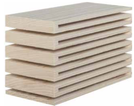
Elite en bois, tissu ou cuir.

Ce WoodenBoxspring peut se fabriquer à partir de différentes essences de bois massif mais aussi de bois laqué de caractère contemporain, classique ou design. Il peut bien entendu être associé à une tête de lit