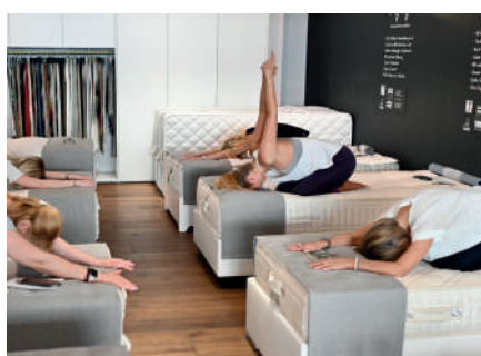
4. La posture de l'enfant