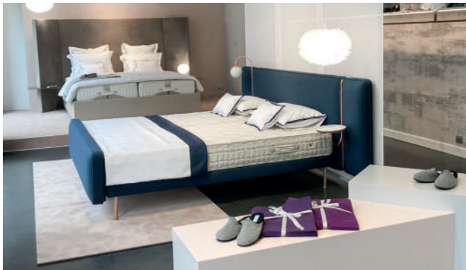
Elite Gallery Lucerne

Désireuse d'offrir un conseil personnalisé de proximité, Elite a récemment inauguré deux nouveaux showrooms à Lucerne et à Gstaad. Désormais, vous avez deux raisons supplémentaires de nous rendre visite!