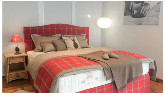
Elite Gallery Gstaad

Notre première boutique est idéalement située dans un quartier historique et commerçant du centre-ville de Lucerne, la seconde au centre du village de Gstaad. Ces espaces dédiés à la qualité du sommeil et au bien-être viennent renforcer les 6 autres showrooms présents sur le territoire helvétique, assurant à Elite une vitrine durable.